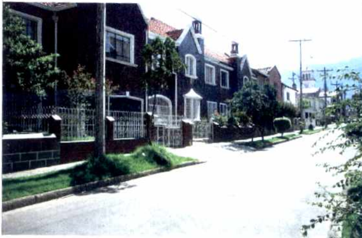
CRITERIOS DE CALIFICACION

✓ Representar en alguna medida y de modo tangible o visible una o mas épocas de la historia de la ciudad o una o mas etapas de la Arquitectura y/o urbanismo en el País.